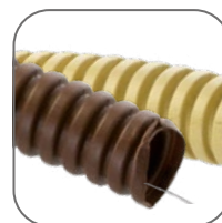
Цвет: белый, серый, светлое дерево, темное дерево