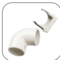
Все необходимые аксессуары