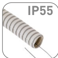
Степень защиты IP55