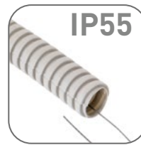
Степень защиты IP55