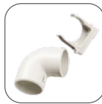
Все необходимые аксессуары